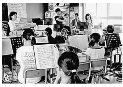
▶ 小学生に演奏披露

マーチングバンドの吹奏楽研究会は、地域イベントでのアトラクションやパレードに参加し、演奏や地域貢献を展開している。 7月26、28の両日には、川崎市宿河原小学校を訪問し指導を行った。部員10人が、金管クラブに所属する4〜6年の20人に、同小の顧問の先生と一緒に直接指導し、演奏も披露した。