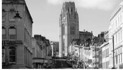
滞在了したプリストルで