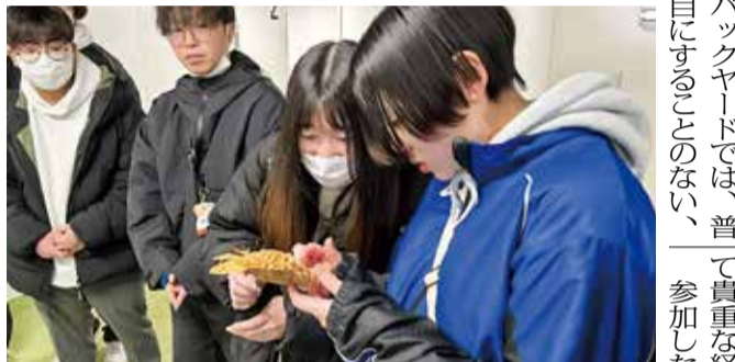
貴重な抜け殻に実際に触れて観察

バックヤードでは、普段目にするのではない、貴重な抜け殻に実際に触れて観察。岩手県花泉高は、「骨格標本や生体の展示によって、生き物の生態や進化の痕跡を分かりやすく知ることができた。生物の種類豊富な観察の観点から、水族館での観察の有効性を感じた」と話した。