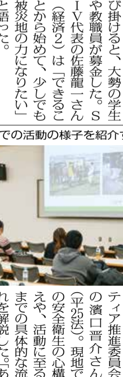
募金の呼び掛けに大勢の学生らが協力した

能登半島地震の被災地を支援しようと、1月、アソの学生たちが募金活動を行った。SKVは11日から、傘下団体SKV(専修神田ボランティア)、SIVは15日から、いずれも募金の呼び掛けに大勢の学生らが協力した。=神田キャンパス