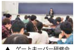
▲ ゲートキーパー研修会