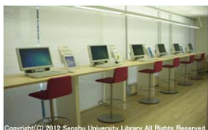
PCコーナー（グループ学習エリア1）

Copyright(C) 2012 Senshu University Library All Rights Reserved.