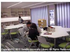
グループ学習エリア1

Copyright(C) 2012 Senshu University Library All Rights Reserved.