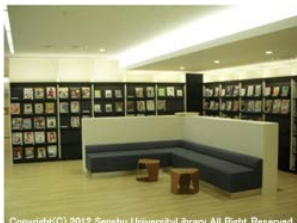
ブラウジングコーナー

Copyright(C) 2012 Senshu University Library All Rights Reserved.