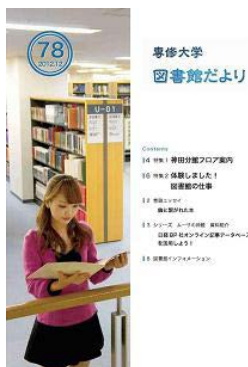
図書館だより 第78号 (2012.12)

「図書館だより 第78号」(2012.12)ができました。各館カウンターで配布していますので、ぜひ、手にとってご覧ください。