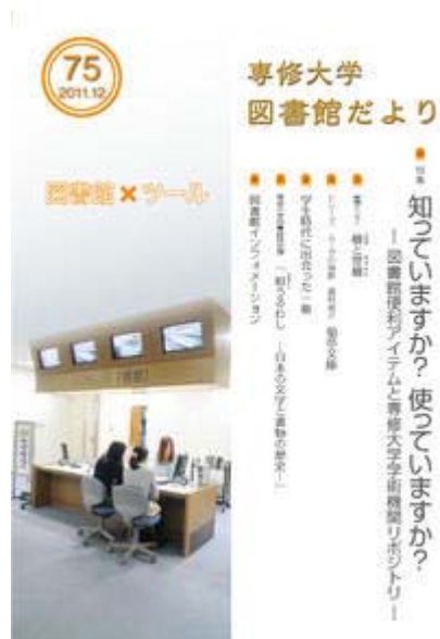
「図書館だより 第75号」(2011.12) (2.9MB) ができました。