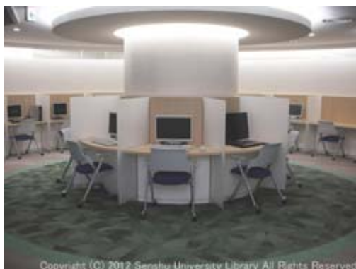
AV・PCラウンジ (PDF: 443KB)

内部はこれまでのままですが、蓋付きの飲み物を持ち込んで飲むことができるようになりました。オープンは4月3日(火)です。