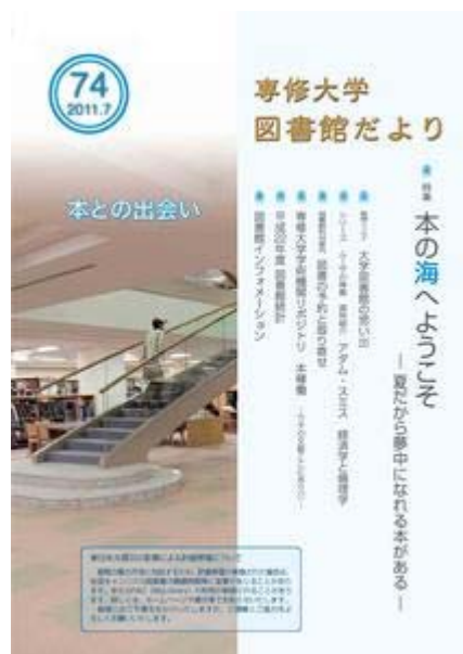
「図書館だより 第74号」(2011.07) (3.3MB) ができました。