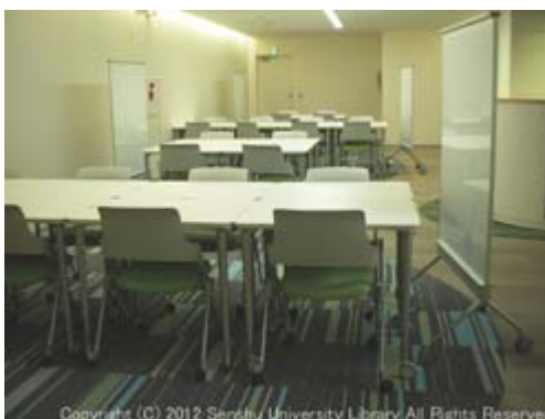
グループ学習エリア2 (PDF: 489KB)