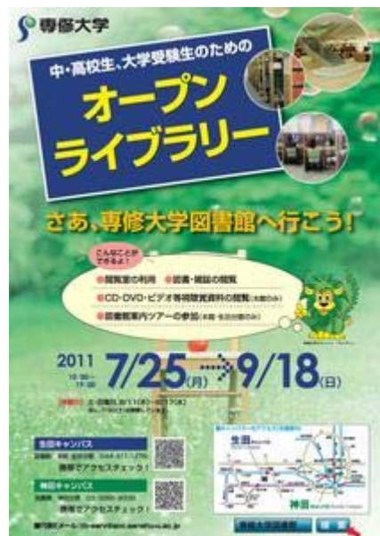
ポスター (PDF: 343KB)

専修大学図書館では、中学生・高校生・大学受験生を対象に、夏期に図書館を勉学の場として開放するオープンライブラリーを実施いたします。閲覧室での勉強や、図書・雑誌の利用ができます。生田キャンパスの本館ではCD・DVD・ビデオなどを視聴することもできます。また、本館・生田分館では、「図書館案内ツアー」も実施しています。