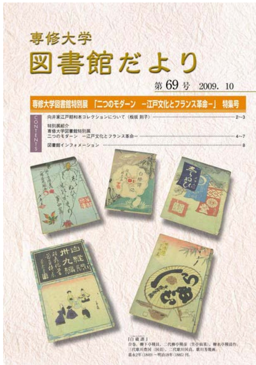
専修大学図書館だより 第69号 (2.2MB)

「図書館だより 第69号」(2009.10)ができました。 各館カウンターで配布していますので、ぜひ、手にとってご覧ください。