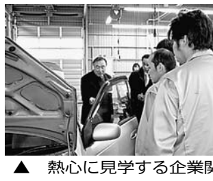
▲ 熱心に見学する企業関係者

「なかなか目の見ることがない基礎的な研究のため、評価を受けにくいのですが、受賞は正直言ってうれしいです。」