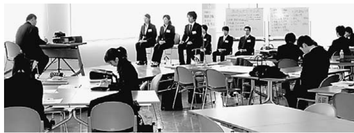
本番さながらの実践トレーニングに学生たちも真剣な表情

就職活動本番を迎える3年次生を対象にした「模擬面接講座」が昨年12月と今年1月の2回、