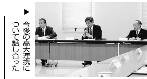
▲ 今後の高大連携について話し合った

石巻地域高等教育事業が主催する「石巻専修大学と圏域高等学校との懇談会」が1月23日、本学で開かれ、今後の高大連携の進め方について話し合った。高校側からは石巻地区の高校12校の校長が出席し、本学から