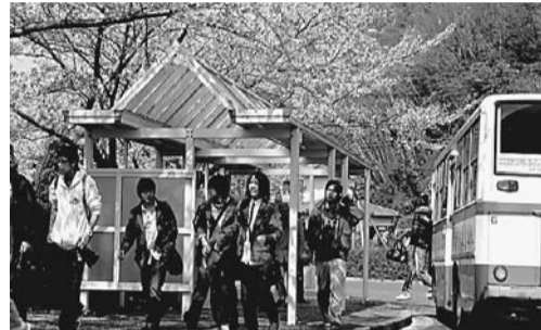
▲ 路線バスは利用者も多く、好評

4月から、仙台市や宮城、県北部地域からの遠距離通学者を対象に、大学独自の通学支援バスの運行を始めた。ルートは仙台駅東口―大学間と、県北部地域(登米市周辺)―大学間の2路線。 仙台駅発着のルートは21日から運行開始。三陸自動車道を利用して大学までノンストップで直行する。授業時間に合わせる。授業時間に合わせる。授業時間に合わせる。 朝、朝夕2便を運行。朝は仙台駅を午前8時10分発、同9時20分大学着。夕方、仙台駅を午後6時30分発、同7時40分大学着。JR仙石線を利用するよりも通学時間は大幅に短縮される。 県北部ルートも2便で4月1日から運行。朝は午前7時50分に登米市役所(佐辺)発、同9時20分大学着。夕方は大学を午後6時30分発、登米市役所同8時着。2便とも石巻駅、柳津駅を経由する。 現在、仙台から仙石線まで通学する学生は約400人。一方、県北部地域出身の学生は約1300人。これらの取り組みにより、各々の通学を支援する環境が整った。今後とも利便性向上のため、通学支援のあり方について鋭意見直すこととしている。