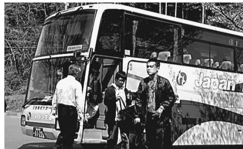
▲ 仙台直通バスを利用する学生