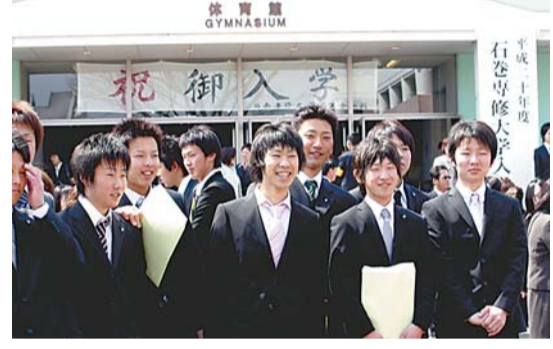
▲ 入学式を終えての記念撮影