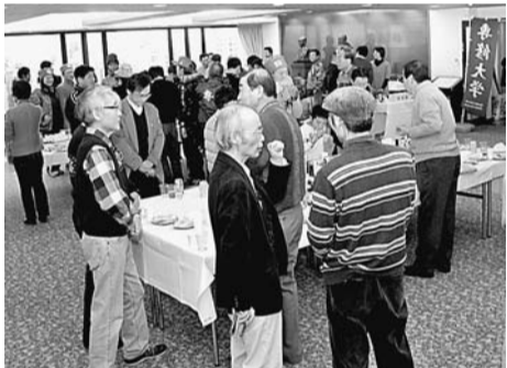
▲ 応援ポイントから多くの方が駆けつけ、熱い思いを語り合った。

1月3日、神田キャンパスで「箱根駅伝の応援に感謝する会」が初めて開催された。校友、育友、留學生ら約150人が参加し、連日わたる応援の労をねぎらい、2011年の箱根駅伝に向けて結束を固めた。今年度は計12の応援ポイントを設定し、各ポイントに賛同していただき、今年度は1000本の旗を立て、多くの留學生を送った。当日の応援ポイントから多くの方が駆けつけ、熱い思いを語り合った。