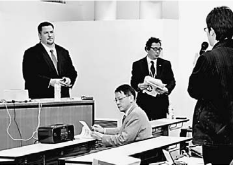
▲各教室ではOB・OGが質疑に応じた

本格化する就職活動を前に、3年次生が卒業生からアドバイスを受ける「学内OB・OG訪問」が11月26日、神田キャンパスで開かれた。広告、銀行、自動車関連といったさまざまな企業で活躍する19人の先輩たちが、直接相談のついでに、貴重な機会とあって、600人以上の学生が参加した(写真は参加OBの自己紹介の様子)。