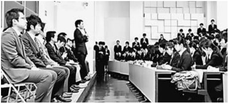
▲多くの学生が参加した(写真は参加OBの自己紹介の様子)

「学内OB・OG訪問」が11月26日、神田キャンパスで開かれた。広告、銀行、自動車関連といったさまざまな企業で活躍する19人の先輩たちが、直接相談のついでに、貴重な機会とあって、600人以上の学生が参加した(写真は参加OBの自己紹介の様子)。