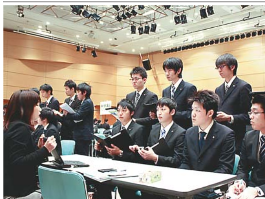
▲ 企業の採用計画や求められる人材などの情報を真剣な面持ちでメモをとる学生たち

本学では3年次生を対象に、採用計画や企業が求める人材などの情報を直接聞く学生180人が参加。学