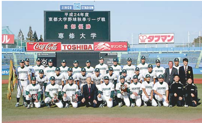
▲ 1部復帰を果たした部員たち