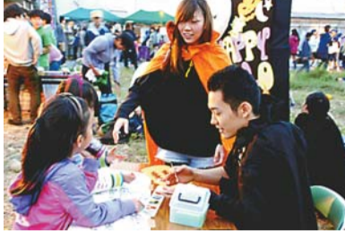
▲ ハロウィーンムードを演出した前川ゼミ生

また前川ゼミ生20人は、10月31日のハロウィーンが間近とあって、来場者に仮装グッズを提供してイベントを施すなどハロウィーンムードをつ