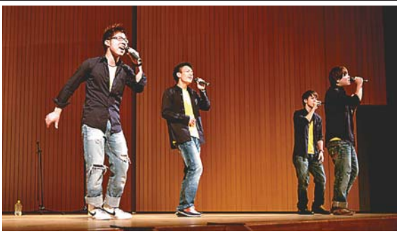
▲ 熱唱の Emo Hill は「星のかけらを採りに行く」と「フェアストラップ」などJポップスを中心に7曲を歌い上げ、日ごの練習の成果を披露。場内は拍手も飛び出し、和やかな雰囲気にも包まれた。