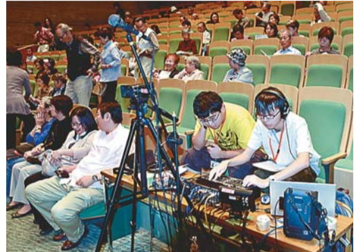
▲ 「かわさきワンセグ」配信も多摩区3大学連携協議会が専修大学、日本女子大学、明治大学の多摩区3大学が連携、文京区に「かわさきワンセグ」の上映会が中心に多くの来場者があった。エンディングテーマが流れると会場は感動の拍手に包まれた。