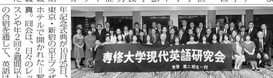
専修大学現代英語研究会 会報 第二期生一同