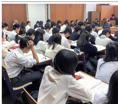
「将来検察官になりたい」という気持ちで頑張ったなどの感想が寄せられた。(エクステンションセンター事務課)

スケットボールで汗を流し、一緒に汗を流した。同スポーツ大会は、2014年まで生田キャンパス北グラウンドでサッカー大会として開いていたが15年からは会場を変えバスケットボール大会を開催、今回は学生5チームに加えご父母・保護