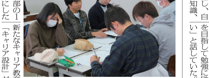
自己理解を深めるグループワークに取り組み学生=10月24日