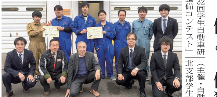
「第32回学生自動車研...」